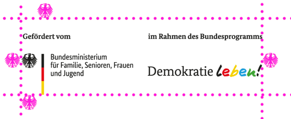
Illustration: Schutzraum um das Logo